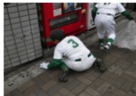
チーム単位でゴミを拾います。