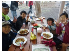
中央青少年交流の家（静岡） オリンピック記念青少年センター（東京） 国立能登青少年交流の家（石川）