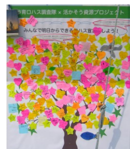
環境省（活かそう資源プロジェクト）（東京）