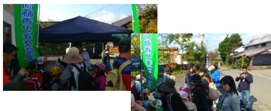
国立能登青少年交流の家（石川） 阿蘇青少年交流の家（熊本）

ウォーキングコース上にいくつか食べ物コーナーを設置し、ポイントで地域の食材を使った料理や特産物を食べながら歩きます。