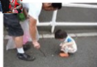
小さな子でも参加できます。