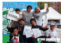
優勝チームを決定します。