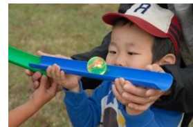
阿蘇青少年交流の家（熊本） 国立吉備青少年交流の家（岡山） ウォーキングフェスタ東京（東京） オリンピック記念青少年センター（東京） 中央青少年交流の家（静岡）