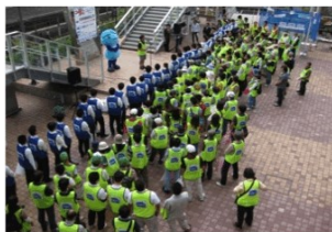
職員と地元商店会などと合同で実施。